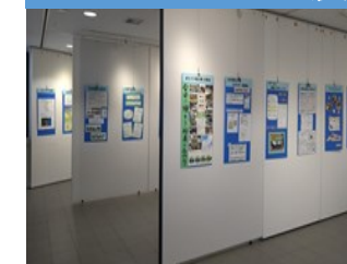
ボードの新規作成も受付中です!

登録団体の皆さんによる活動の歩みや日頃の活動紹介など、想い想いの伝えたい!をメッセージボードに込めて作成していただきました。50団体のボードを展示しました。