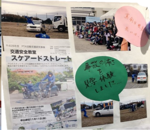
2/25~2/27開催 白井市P連 写真展示会

展示会では、市内小中学校通学路の危険箇所マップ、自治会と協力して小学校で行われた防災リアル訓練、保護者向け講演会、親子で参加する交通安全教室など、1年を通じた活動の様子を知ることができました。