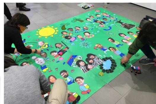
一活動の楽しそうな雰囲気が伝わってほしい、という思いで作成したパネル。昭和テイストなデザインが面白く、思わずじっと眺めてしまいます。

「PTA活動というと、『何をしているのかよくわからない』『大変そう』という声もあります。子ども達が安全な環境で学校生活を送れるよう保護者が見守っていくことは、PTAとして特に大切な役割だと思っています。また、コロナになる前は飲み会もよくやっていた。それぞれの仕事のことや子どものことを気兼ねなく話せるのは良いところですね。また、PTA活動を通して地域の方と顔見知りになり、自治会に関わるきっかけにもなりました。活動を通して生まれた様々なつながりは、これからの自分の暮らしを楽しくしてくれると思っています。」と話されました。