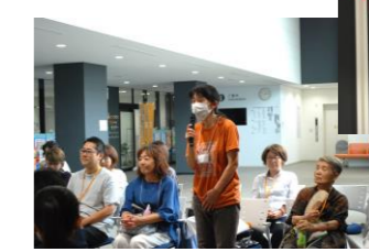
団体の方々からも感想、コメントをいただきました