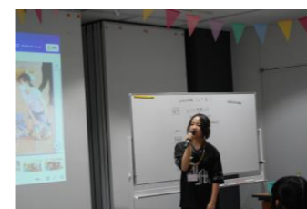
ワカモノたちに活動中の写真を映しながら、NPO体験会の感想を語ってもらいました。

若者と団体参加者全員で記念撮影を行いました。笑顔で写真に納まる皆の楽しそうな顔が印象的でした。市民団体の多くの方からは、若者の市民活動への参加に感謝の言葉を語っていました。今後も若い人たちの市民活動への参加を募るとともに、若者独自の視点で新たな活動を始めてもらえるよう、大人たちが応援する環境を作っていきたいと思っています。