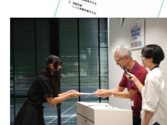
ボランティア証明書を1人1人に授与しました!