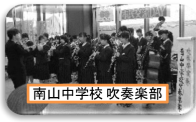
南山中学校 吹奏楽部