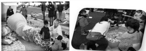
こいのぼりトンネル、SDGs海の豊かさを守ろう!