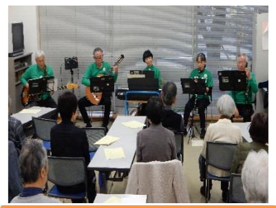
2019年11月お楽しみ処にて

2019年5月10周年記念音楽会が、まちサポ多目的スペースで開かれました。ユーカリアンサンブルは、人々の心を癒す楽器演奏を通し、社会教育に貢献、かつ芸術の復興に関わることを目的として活動しています。いろいろな楽器を手にして集まったメンバーたちが、心を一つにして演奏している姿はとてもアットホームな雰囲気があります。音楽の楽しみを多くの人たちにも届けたいという思いで、積極的にボランティア活動をしているそうです。仲間募集中です。一緒に音楽を楽しみたい方、ボランティア精神をお持ちの方、練習体験受付中とのことです。ぜひ覗いてみてはいかがでしょうか