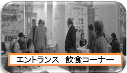
エントランス 飲食コーナー