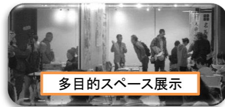
多目的スペース展示

2019年5月、実行委員会が立ち上がり、何度も会議を積み重ね、共に作り上げた、第一回まちサポひろば～市民交流DAY～は、参加者:540名、出展団体:38団体の市民交流イベントになりました。