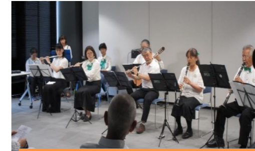
昨年の5月10周年記念音楽会にて