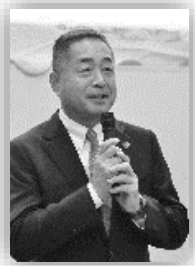
笠井市長によるあいさつ