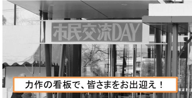
力作の看板で、皆さまをお出迎え!