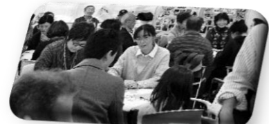
9つの小学校区地区自慢大会