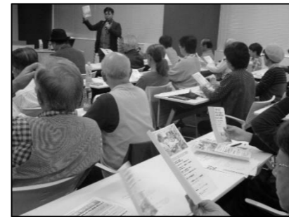
活動紹介チラシのビフォー・アフターを例にとり、分かり易い説明に思わず納得。

令和元年10月27日(日)に開催した広報講座。団体活動の中でイベント告知や会員募集をしたいときに必ず必要となる「チラシ」づくり。デザインやキャッチコピーをどう工夫したら、届けたい情報がより伝わるかという視点で講座が始まりました。