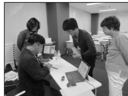
講義の中で取り上げられなかった媒体については個別にコメント。より実践的な助言がありました。

受講生の皆様に、よりリアルなチラシ作りを体験してもらうため、白井市で活動している架空の団体のチラシをテキストにして、どんなレイアウトが良いか、フォントや色使いはどう工夫したらよいか、チラシの原稿の作り方など、丁寧に例をみながら教えていただきました。