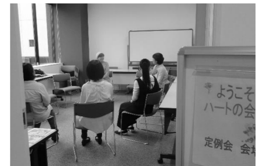
毎月第三土曜日定例会を開催してます。 お気軽にお問合せ下さい。