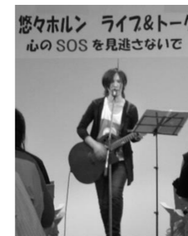
8月25日 悠々ホルンさんのライブ &トークを開催しました。