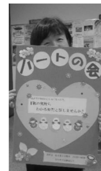
PRボード見てください！

ハートの会は 必要な時にすぐ参加でき、安心してなんでも話せるフラットな場所です。今起こっていること、今の想いを、正直に、あるがままに語れる場所です。どうぞご連絡ください。